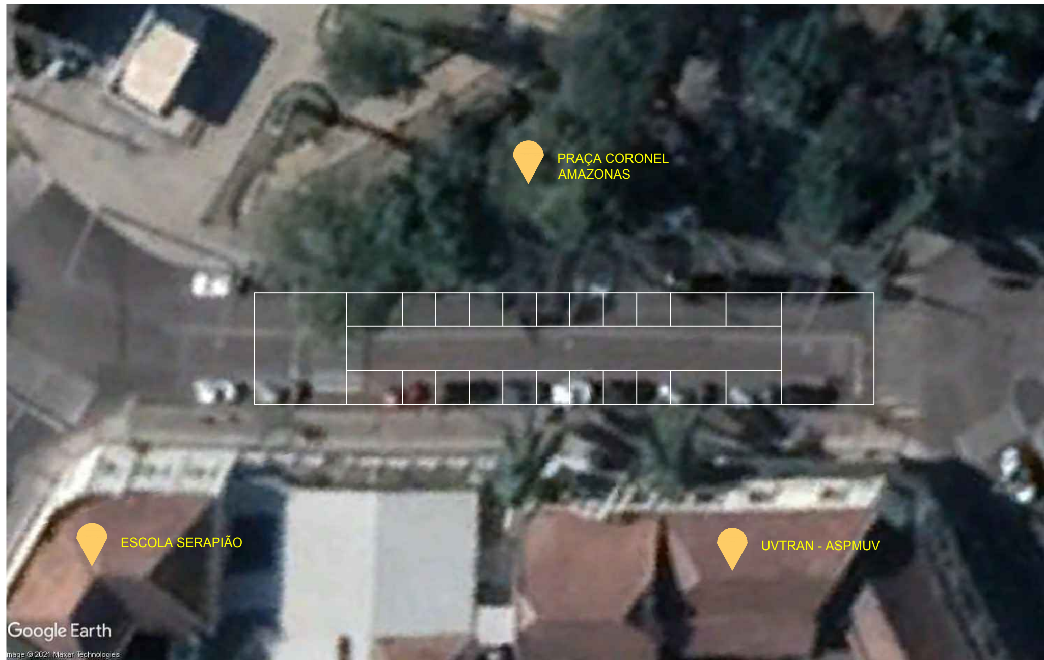
ESPAÇOS RUA FRENTE ANTIGA PREFEITURA LAYOUT DA DISTRIBUIÇÃO DOS ESPAÇOS PARA RUA DE ALIMENTAÇÃO QUERMESSE Sem Esc. Definida