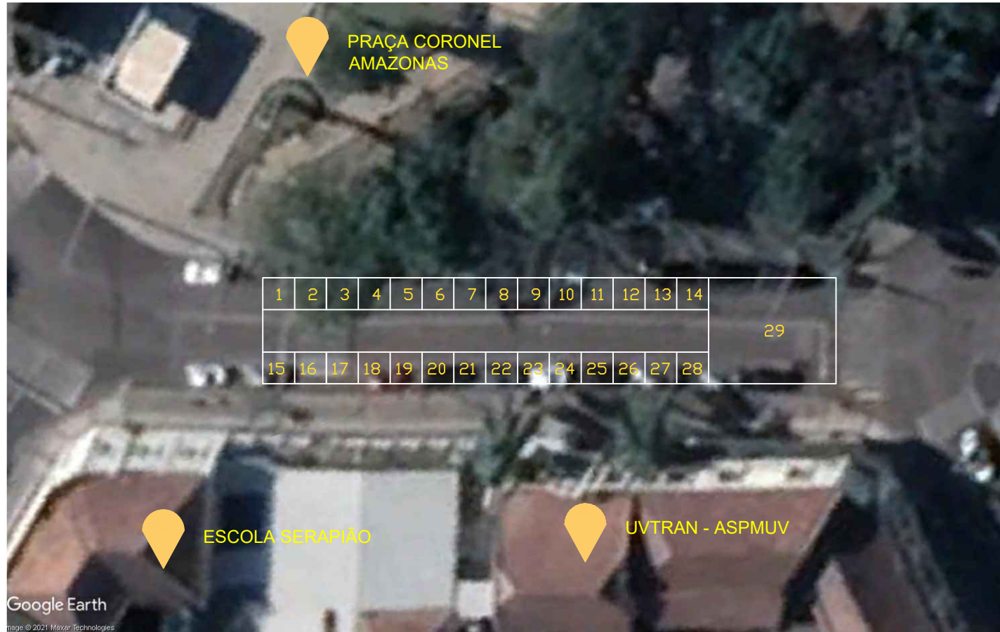
ESPAÇOS RUA FRENTE ANTIGA PREFEITURA LAYOUT DA DISTRIBUIÇÃO DOS ESPAÇOS PARA RUA DE ALIMENTAÇÃO Sem Esc. Definida